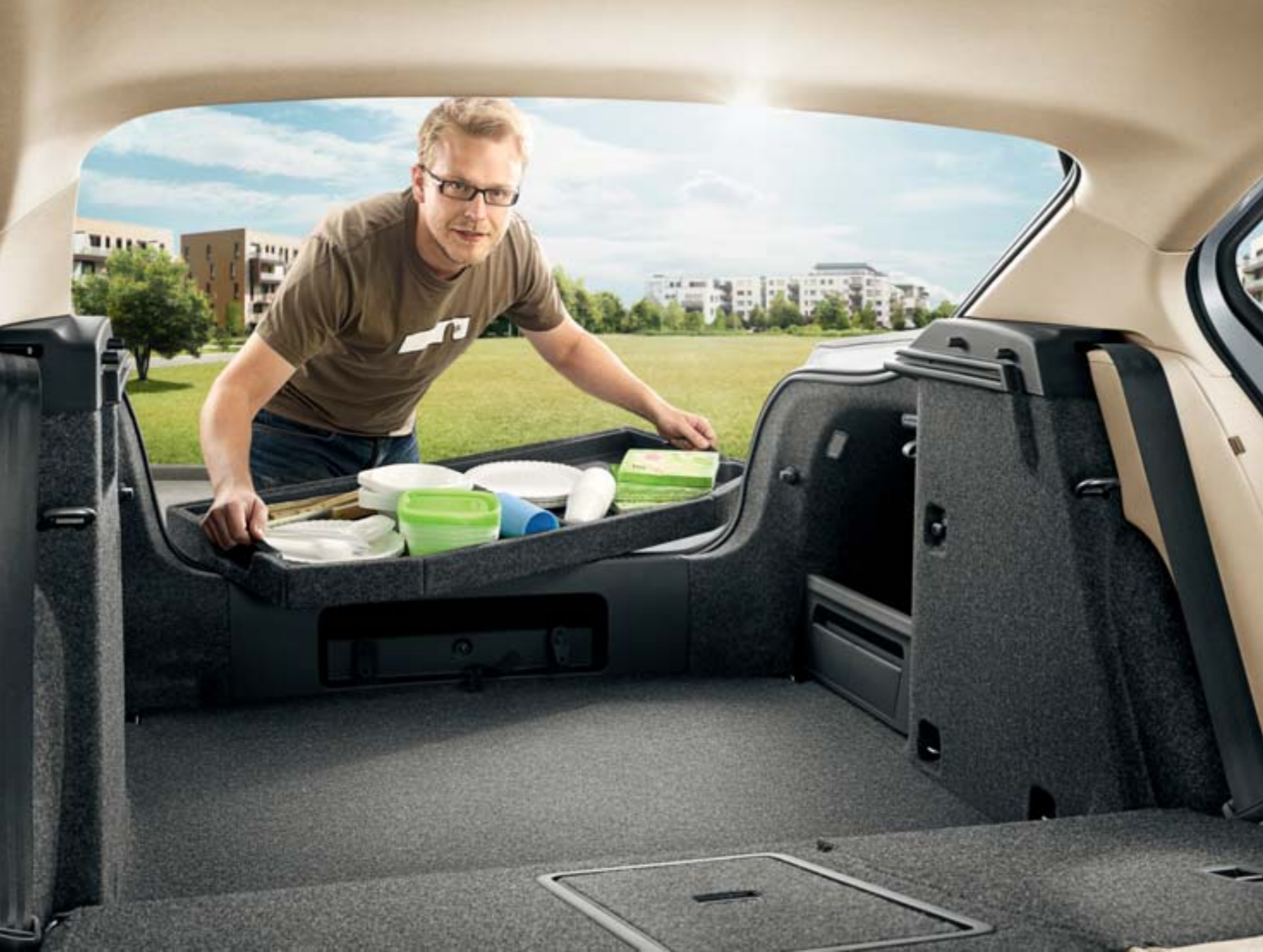
Organizér zavazadlového prostoru (5JA 061 109)