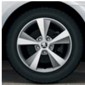
Kolo z lehké slitiny Velorum 6,5J x 16" pro pneumatiky 205/55 R16, ve stříbrné barvě (5E0 071 496C 8Z8)