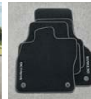
Textilní autokoberce Prestige , čtyřdílné sady (5E1 061 404 pro levostranné řízení, 5E2 061 404 pro pravostranné řízení)