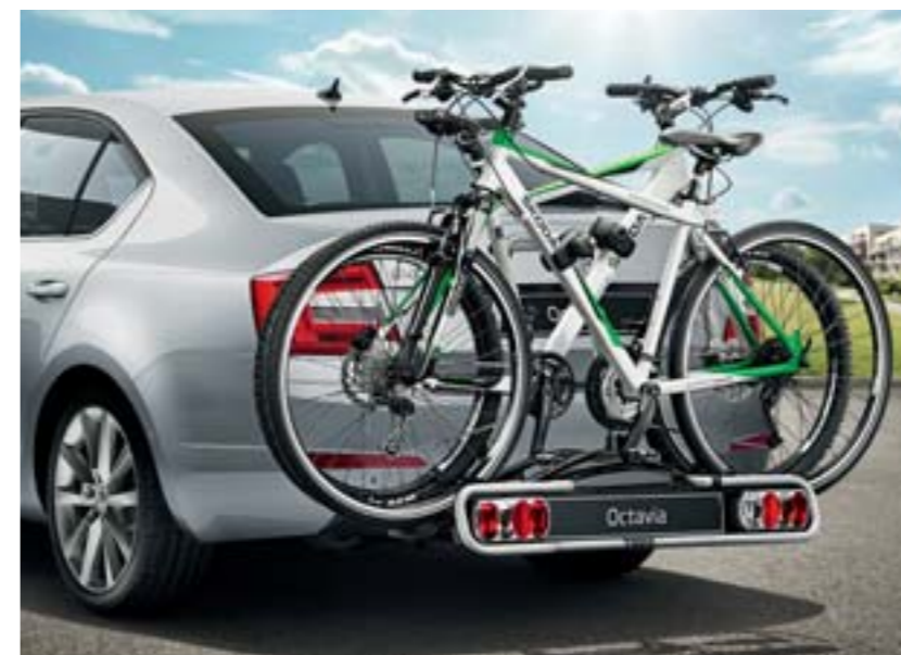
Nosič jízdních kol na tažné zařízení, kapacita 2 kola (3T0 071 105)