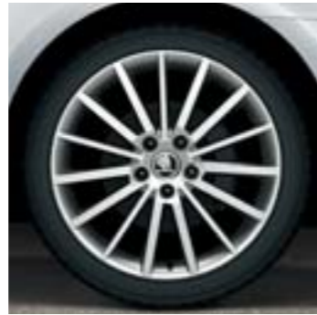
Kolo z lehké slitiny Turini 7,5J x 18" pro pneumatiky 225/40 R18, ve stříbrné barvě (5E0 071 498B 8Z8)