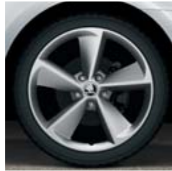
Kolo z lehké slitiny Golus 7,5J x 18" pro pneumatiky 225/40 R18, ve stříbrné barvě (5E0 071 498C 8Z8)