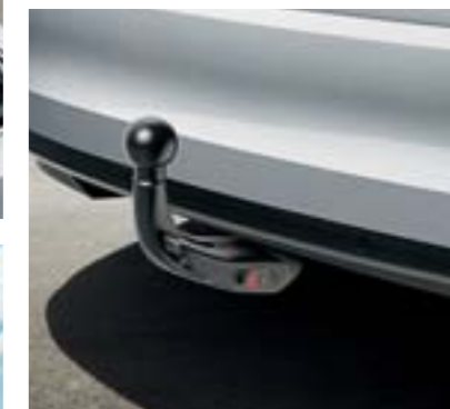
Odnímatelné tažné zařízení (5E0 092 155) Elektroinstalace s 13pólovou zásuvkou (5E0 055 316A pro vozy bez přípravy pro tažné zařízení, 5E0 055 316 pro vozy s přípravou pro tažné zařízení)