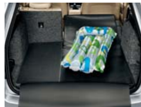
Gumotextilní rozkládací koberec do zavazadlového prostoru, oboustranný, pro model Octavia Combi (5E9 061 210)* – na snímku částečně rozložený koberec, gumová strana