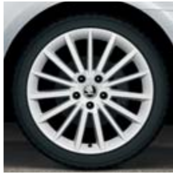
Kolo z lehké slitiny Turini 7,5J x 18" pro pneumatiky 225/40 R18, v bílé barvě (5E0 071 498A FM9)*