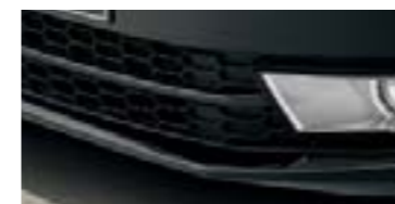
Chromovaná lišta předního spoileru (5E0 071 004)*