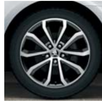
Kolo z lehké slitiny Hawk 7,0J x 17" pro pneumatiky 225/45 R17, v černo-stříbrné barvě (5E0 071 496 JX2)