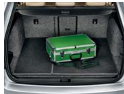
Gumotextilní rozkládací koberec do zavazadlového prostoru, oboustranný, pro model Octavia Combi (5E9 061 210)* – na snímku textilní strana