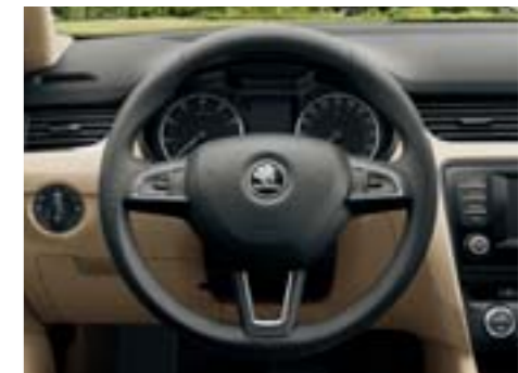
Tříramenný kožený volant , multifunkční pro ovládání rádia a telefonu (5E0 064 241B CWE)*

Sportovní styl a více individuality dodá interiéru vozu malý kožený sportovní paket s červenou kůží: volant s červenou kůží (5E0 064 241 CXQ tříramenný sportovní volant, 5E0 064 241A CXR multifunkční pro ovládání rádia, 5E0 064 241B CXR multifunkční pro ovládání rádia a telefonu, 5E0 064 241C CXR multifunkční pro ovládání rádia, telefonu a řazení pod volantem); madlo ruční brzdy s červenou kůží (5E0 064 300); madlo řadicí páky s červenou kůží - levostranné řízení (5E1 064 230A pětistupňová manuální převodovka, 5E1 064 230B šestistupňová manuální převodovka, 5E1 064 230C šestistupňová manuální převodovka 4x4, 5E1 064 220 automatická převodovka, 5E1 064 220A automatická převodovka 4x4)