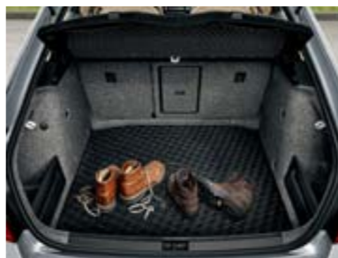
Gumová vložka do zavazadlového prostoru (5E5 061 160 pro model Octavia, 5E9 061 160* pro model Octavia Combi)