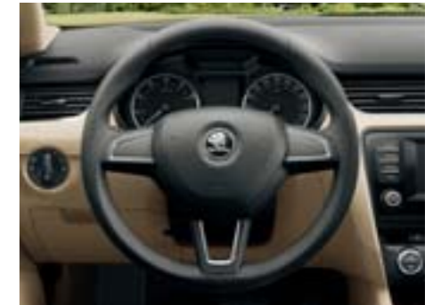
Tříramenný kožený volant (5E0 064 241 CWD)*