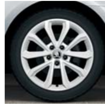
Kolo z lehké slitiny Hawk 7,0J x 17" pro pneumatiky 225/45 R17, v bílé barvě (5E0 071 496B FM9)*