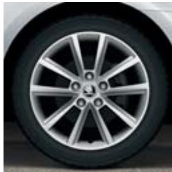
Kolo z lehké slitiny Teron 7,0J x 17" pro pneumatiky 225/45 R17, ve stříbrné barvě (5E0 071 497A 8Z8)