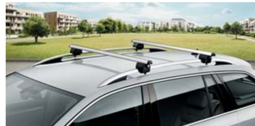
Příčný střešní nosič pro model Octavia Combi (5E9 071 151)*

* K dispozici v průběhu 2. čtvrtletí 2013.