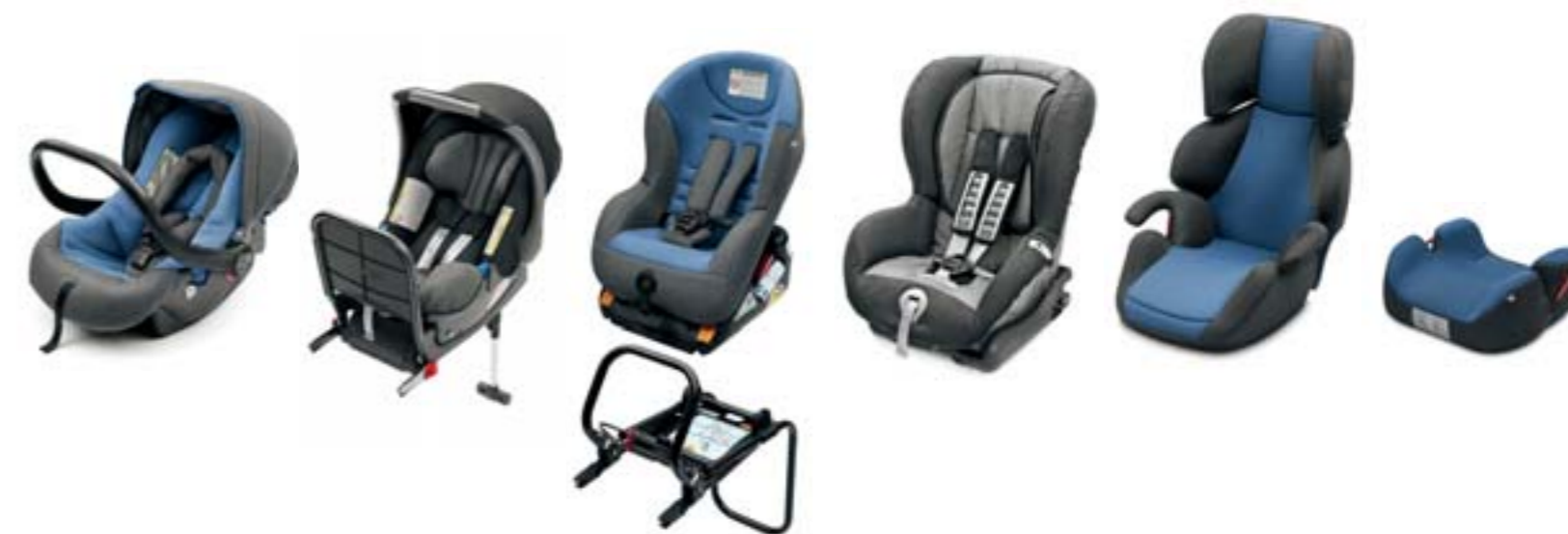
Dětská autosedačka Wavo Kind (5LO 019 900C)