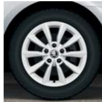
Kolo z lehké slitiny Premia 6,5J x 16" pro pneumatiky 205/55 R16, v bílé barvě (5E0 071 494 FM9)*