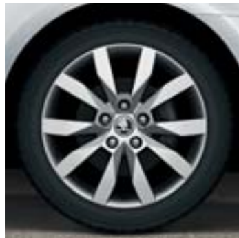
Kolo z lehké slitiny Crystal 6,0J x 17" pro pneumatiky 205/50 R17, ve stříbrné barvě (5E0 071 496A 8Z8)* - vhodné pro použití sněhových řetězů