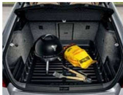
Plastová vana do zavazadlového prostoru (5E5 061 162 pro model Octavia, 5E9 061 162* pro model Octavia Combi)