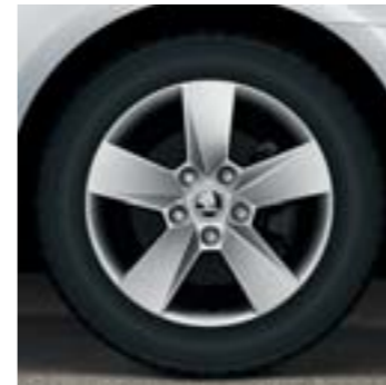
Kolo z lehké slitiny Ilias 6,5J x 16" pro pneumatiky 205/55 R16, ve stříbrné barvě (5E0 071 496D 8Z8)