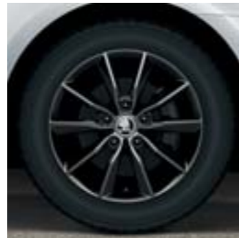
Kolo z lehké slitiny Premia 6,5J x 16" pro pneumatiky 205/55 R16, v černé barvě (5E0 071 494 JX2)*