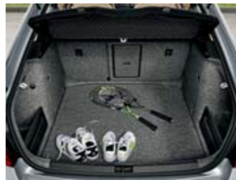
Gumotextilní koberec do zavazadlového prostoru, oboustranný (5E5 061 163A pro model Octavia, 5E9 061 163A* pro model Octavia Combi) – na snímku textilní strana