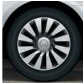
Velkoplošné kryty Tekton pro kola 6,5J x 16", čtyřdílná sada (5E0 071 456A)