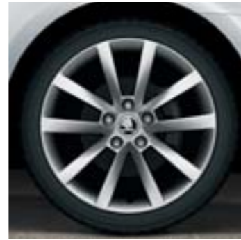
Kolo z lehké slitiny Alaris 7,5J x 18" pro pneumatiky 225/40 R18, ve stříbrné barvě (5E0 071 498D 8Z8)