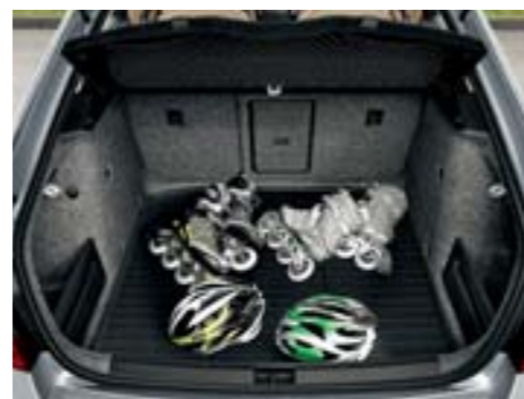
Gumotextilní koberec do zavazadlového prostoru, oboustranný (5E5 061 163A pro model Octavia, 5E9 061 163A* pro model Octavia Combi) – na snímku gumová strana