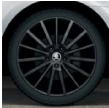
Kolo z lehké slitiny Turini 7,5J x 18" pro pneumatiky 225/40 R18, v černé matné barvě (5E0 071 498 ZG6)