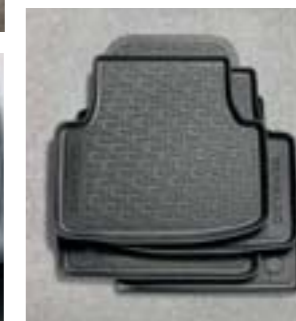
Gumové autokoberce , čtyřdílné sady (5E1 061 550 pro levostranné řízení, 5E2 061 550 pro pravostranné řízení)