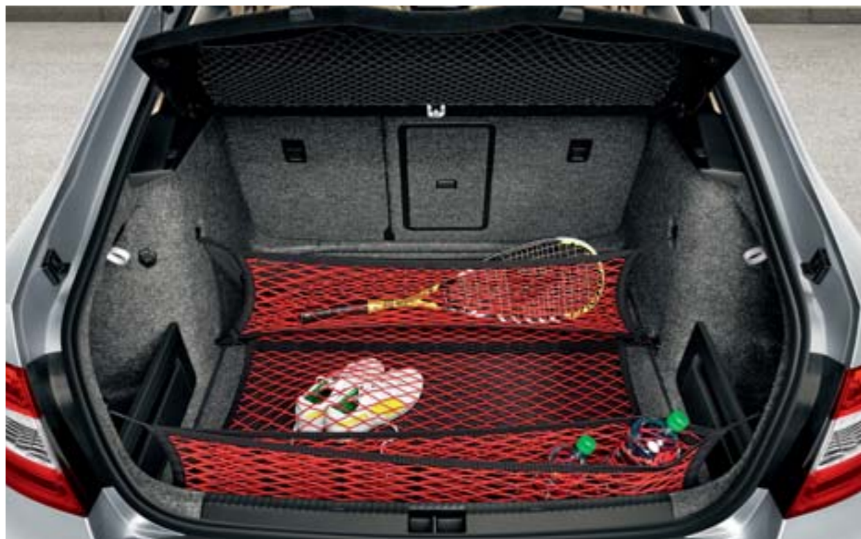
Sítový program , třídílný (5E0 017 700 v červené barvě, 5E0 017 700A v černé barvě)