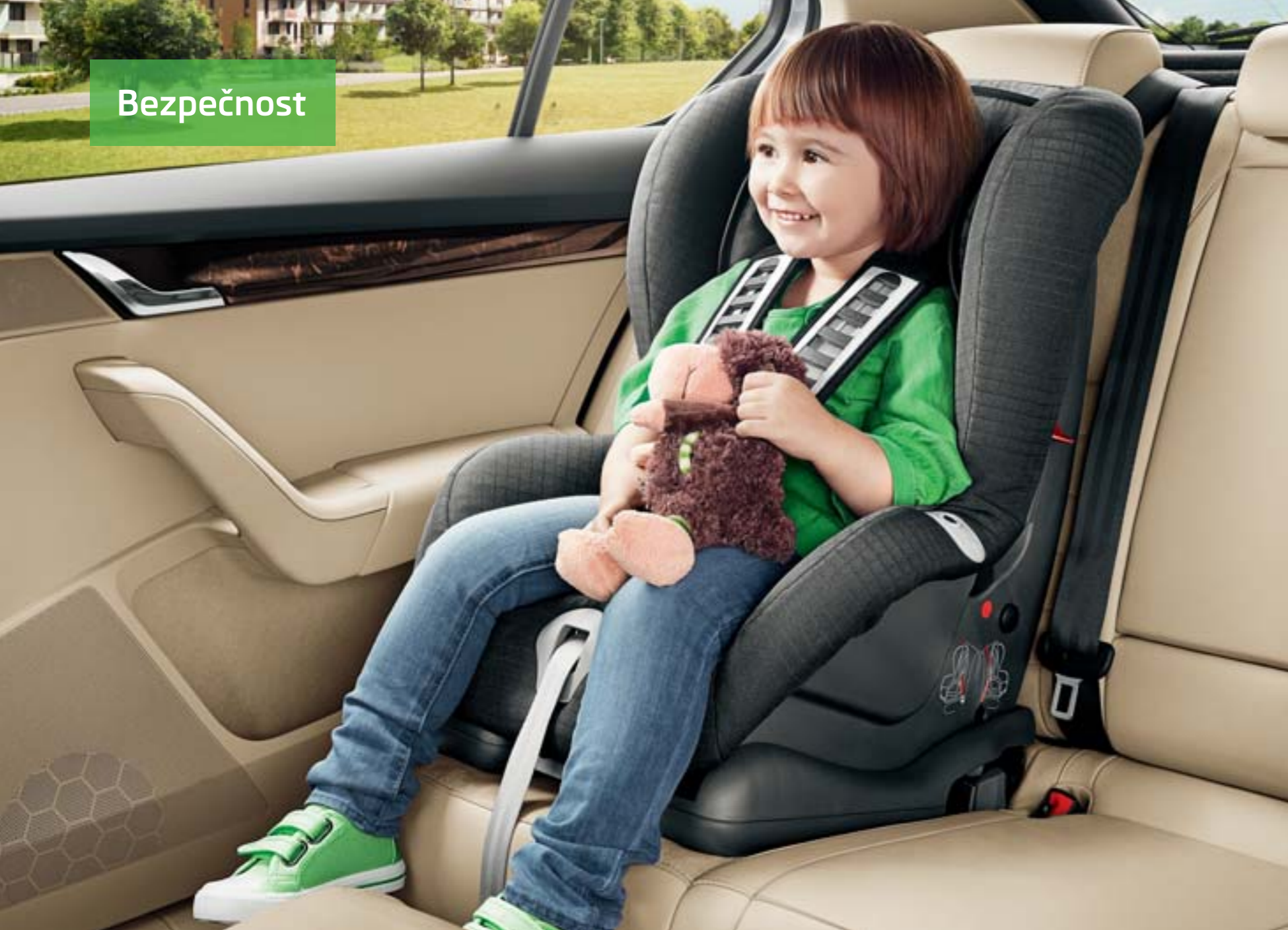
Dětská autosedačka Baby One Plus (5LO 019 900)