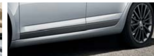
Sada dekorativních fólií v černé barvě s karbonovou texturou pro boční a 5. dveře (5E0 064 317A pro model Octavia, 5E9 064 317A* pro model Octavia Combi)