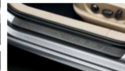
Dekorativní prahové lišty s vložkou z ušlechtilé oceli (5E0 071 303A)