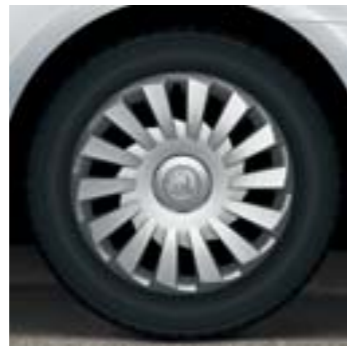
Velkoplošné kryty Nordic pro kola 6,0J x 16", čtyřdílná sada (5E0 071 456)