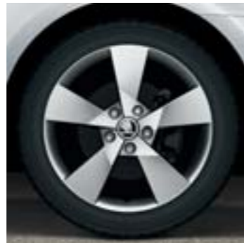
Kolo z lehké slitiny Denom 7,0J x 17" pro pneumatiky 225/45 R17, v černo-stříbrné barvě (5E0 071 497 8Z8)