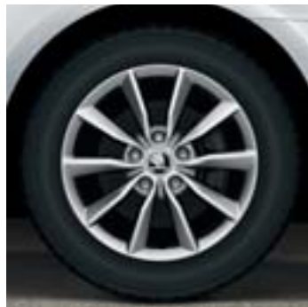
Kolo z lehké slitiny Minoris 6,5J x 16" pro pneumatiky 205/55 R16, ve stříbrné barvě (5E0 071 494 8Z8)