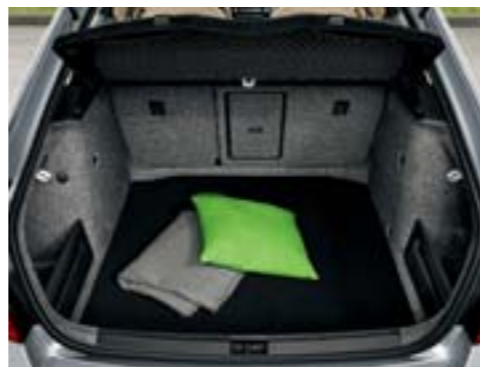
Textilní koberec do zavazadlového prostoru (5E5 061 163 pro model Octavia, 5E9 061 163* pro model Octavia Combi)