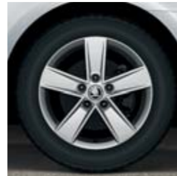
Kolo z lehké slitiny Star 6,0J x 16" pro pneumatiky 205/55 R16, ve stříbrné barvě (5E0 071 494A 8Z8) - vhodné pro použití sněhových řetězů