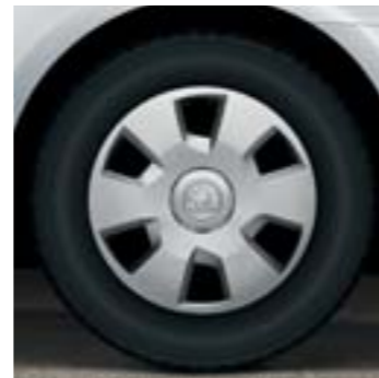
Velkoplošné kryty Sidus pro kola 6,0J x 15", čtyřdílná sada (5E0 071 455)