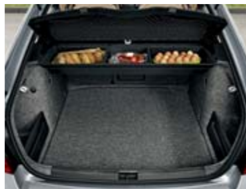
Multifunkční box pod zadním platem (5E5 061 109)*